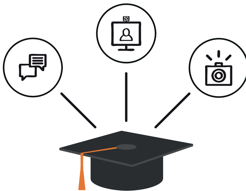
Ilustração: Vanessa Barreto

Os conteúdos de cunho prático serão desenvolvidos tanto a distância, como presencialmente. As atividades práticas propostas pelos professores nesses componentes podem ser desenvolvidas pelos alunos em suas cidades e apresentadas por meio virtual em formato de vídeo, fotografia, videoconferências e disponibilizados no ambiente virtual Moodle.