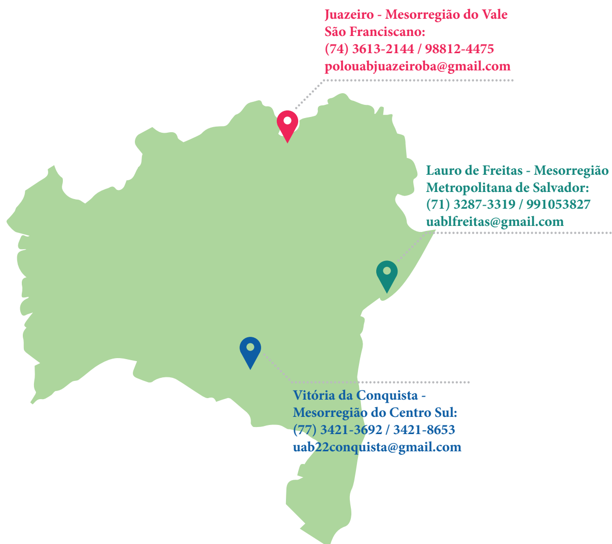
Ilustração: Vanessa Barreto

O Curso de Licenciatura em Dança EAD/UFBA é oferecido nos seguintes municípios baianos: