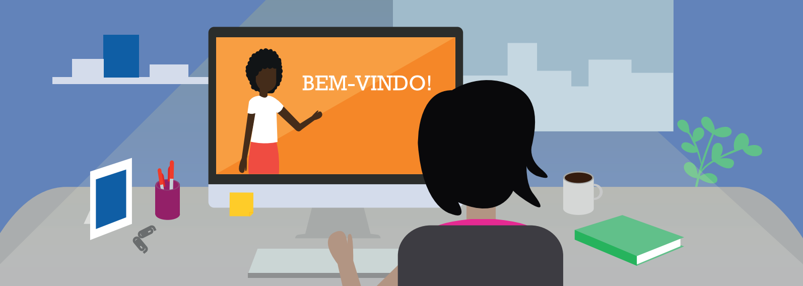
Ilustração: Vanessa Barreto