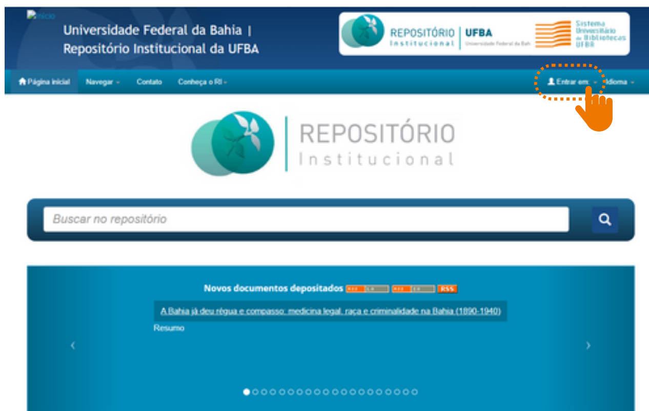
Figura 01 – Acesso ao "Meu Espaço".

Aprendizagem Ata - consuni Atenção primária à saúde Avaliação Bahia Brasil Brazil Cinema Comunicação Corpo Cparq Cparq - memórias Criança Cultura Currículo Dança Direitos fundamentais Education Educação Educação infantil Educação superior Enfermagem Ensino superior Epidemiologia Epidemiology Faculdade de medicina da bahia Formação Formação de professores Gênero História Identidade Internet Jornalismo Memória Mercado de trabalho Mulheres Música Política Políticas públicas Salvador