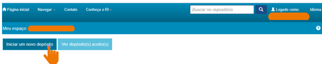
Figura 10 – Primeira etapa para realização de depósito.

Após o recebimento do e-mail de liberação, entre na página do RI/UFBA, insira o login e a senha cadastrada na parte superior, no lado direito da página, e clique em "Meu espaço" e, posteriormente, em "Iniciar um novo depósito", conforme a figura 10.