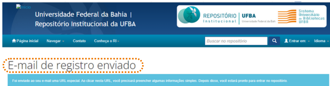
Figura 04 – Registro de e-mail.

Será enviado uma URL especial para o e-mail registrado (figura 04).